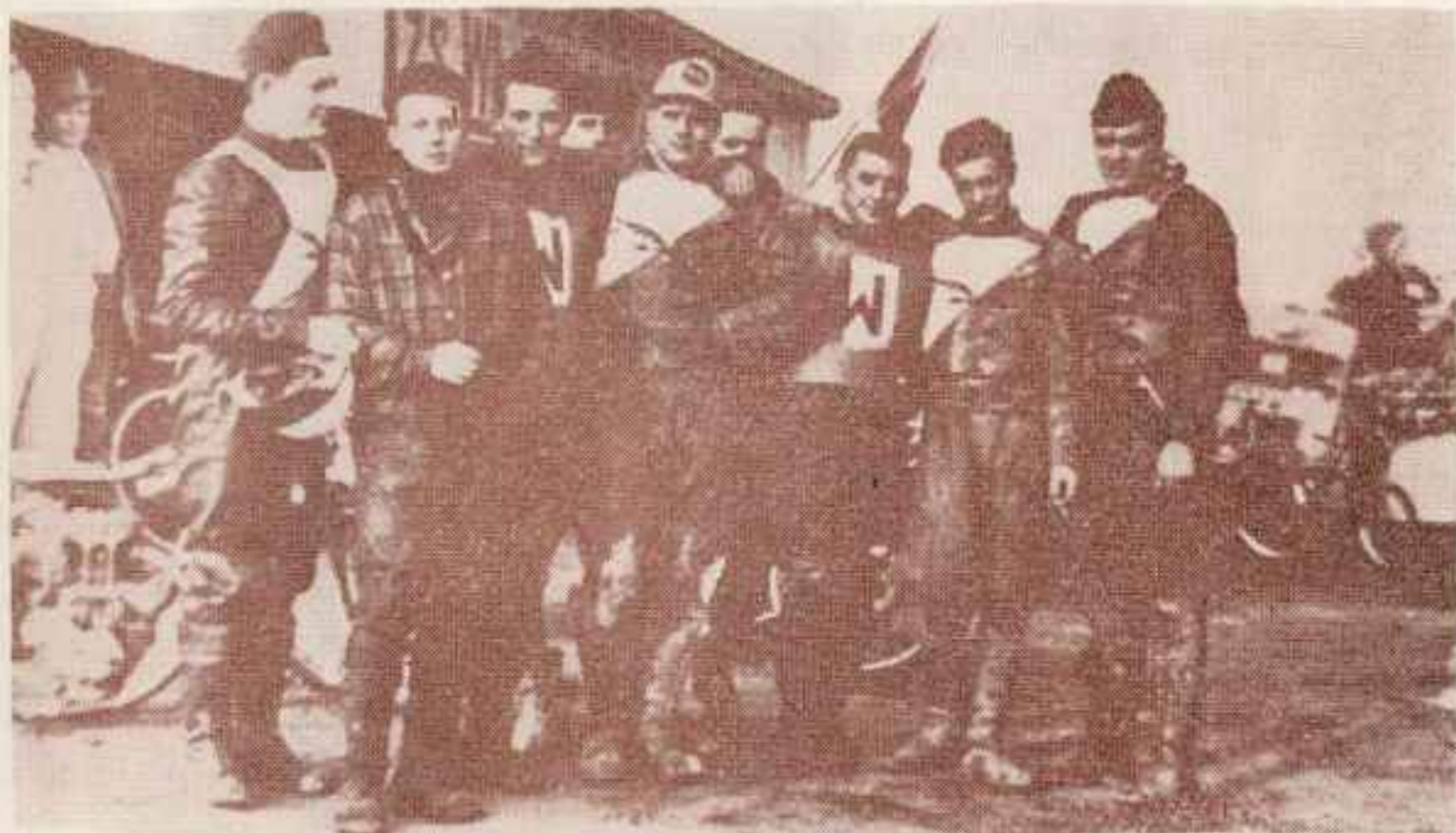
Drużyna HUKAT LAHTI (Finlandia) w Częstochowie

W latach 1952—1954 nie doszło do żadnych kontaktów międzynarodowych. Utworzona świeżo GKSZ energicznie przystąpiła więc do odnawiania dawnych więzów i już w 1955 roku odbyło się kilka imprez z udziałem ówczesnych znakomitości torów. Warto tu odnotować spotkania z Czechosłowacją zakończone zwycięstwem zespołu polskiego 82:26 w Ostrowie i 41:24 we Wrocławiu. Wrocławskie spotkanie zostało przerwane z powodu nadmiernych opadów. Ciekawostką stanowi fakt, że właśnie w tych spotkaniach przeciwnicy po raz pierwszy zaprezentowali nowe motocykle ESO, które wkrótce miały podbić cały żuźlowy świat.