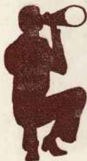
MICHAEL LEE — mistrz świata 1980 r.

GKM Włókniarz prowadzi nabór do szkółki żużlowej Chłopcy w wieku 15-16 lat