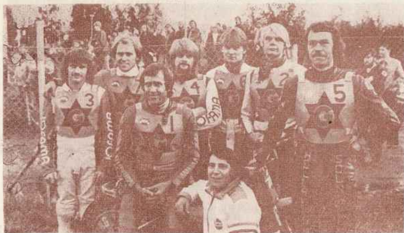
GETINGARNA — drużynowy mistrz Szwecji 1983 r.

W II lidze — Północ mecze rozgrywa się w/g tabeli czwórmeczowej.