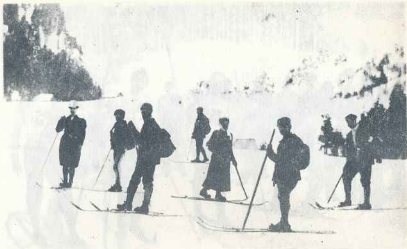
Pierwszy kurs narciarski w Zakopanem, 1907 r.