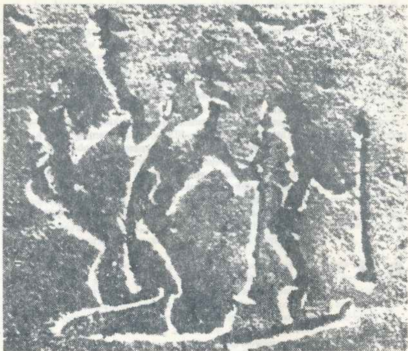
Narciarze z epoki kamienia, rysunek skalny z Załawrug (reprod. fot. z: Narciarstwo, Zarys encyklopedyczny , Pod. red. G. Młodzikowskiego i J. A. Ziemilskiego, Warszawa 1957)