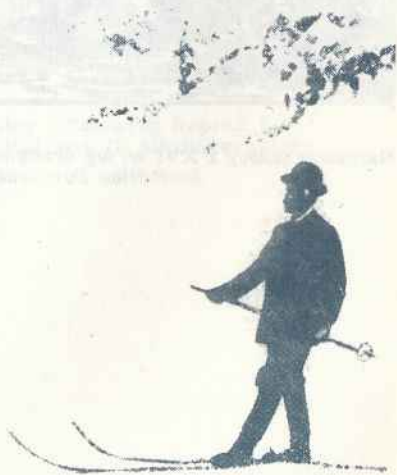
Stanisław Barabasz (1857—1949) — pionier narciarstwa polskiego