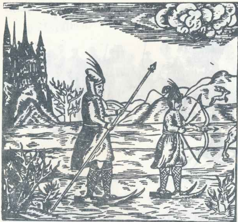
Narciarze polscy z XVI w. wg drzeworytu z dzieła A. Gwagnina Sarmatiae Europaeae descriptio (Kraków 1578)