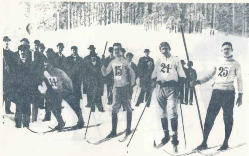
Start do wyścigu o mistrzostwo Karkonoszy, 1897